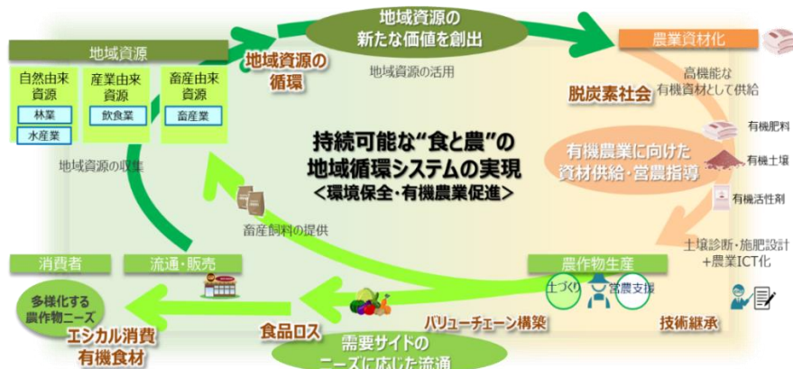
図1：本共同実証において構築を目指す“地域資源循環社会”