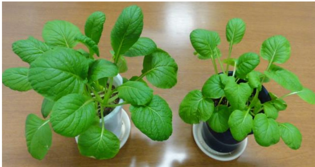
コマツナの栽培比較 (左: SOFIX有機標準土壌、右: 化学土壌)