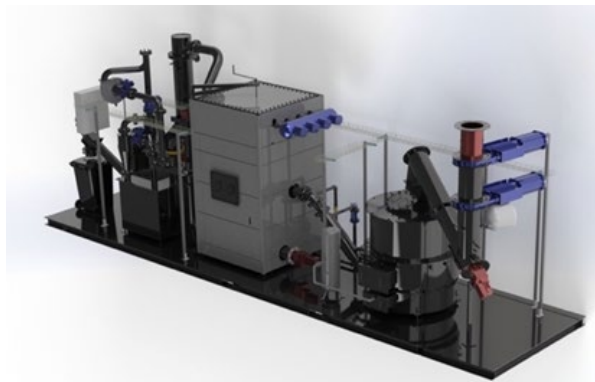
ガス化ユニット(フレーム型)

一方、木質ガス化発電は、日本国内での稼働率が低い事例が多く、生野銀山バイオマス発電所の開発においては、発電所運営事業者に対し「発電機稼働率の保証」付きの契約の締結や「メンテナンス定額単価サービス」を提供することで、事業者のリスクを低減し、事業の安定性を追求します。