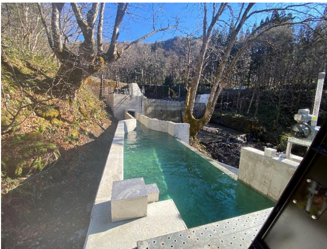
水槽から取水堰堤