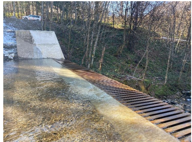
チロリアン取水口