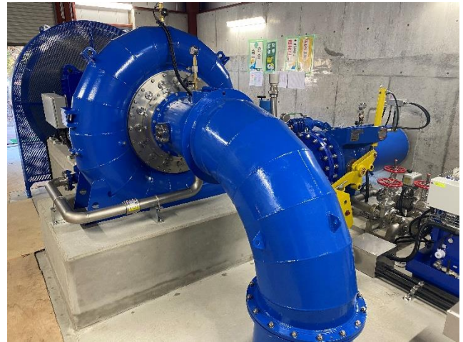
チェコ製 横軸フランシス水車