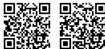
左) 安房谷水力発電所プロモーション 右) 安房谷水力発電所CM

発電所名：安房谷水力発電所 設置場所：岐阜県高山市奥飛騨温泉郷平湯字アカンダナ793-1 河川名：神通川水系高原川支川 安房谷 有効落差：70.0m 最大使用水量：1.110m 3 /s 最大発電出力：657kW 発電方式：流れ込み式 取水施設：既設砂防ダム利用（背面腹付・チロリアン取水） 水圧管路：強化プラスチック複合管（FRPM）埋設 発電所：地上式（制御室別設） 水車の種類：横軸フランシス水車 発電機の種類：三相誘導発電機 年間売電量：約3,275MWh（約1,000世帯分に相当）※電気事業連合会2015年データによる 売電先：中部電力パワーグリッド株式会社（全量FIT） 設備設計：シン・エナジー株式会社