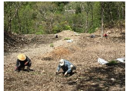
現地で採取したススキの種子から育てた苗を、配管工事後に植栽し原状復帰を図っています

当社は、地域の方々と共同して水力開発の適正ルールを遵守した水力開発を推進することで乱開発を防止するとともに、「植民地型開発」から地域のための「地域貢献型開発」への転換を図ってまいります。